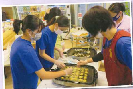
初めて作っています(笑)

12月13日(日)本来ならこの時期は餅つきが行われるのですが今年は断念し、代わりにたこ焼きパーティーを開催しました。とは言えタコは噛み切れない方もいらっしゃるため代わりに竹輪です。当日はスタッフ、事務員さん多数で焼きまくりました。やはり皆さん関西人ですね粉物がお好きなようで…。中にはおかわりされる方もいらっしゃいました。