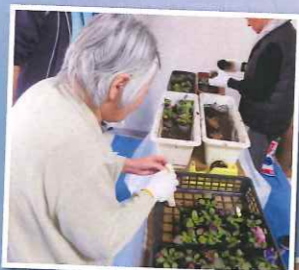
ありがとうございます!