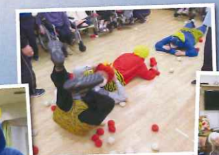
やられてますねー♪