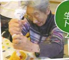
いちごと生クリームをトッピング☆

HEARTFULL 人と人のハートを大切に ハートフルグループ 令和2年度 冬号 第109号