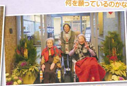
新年あけましておめでとう!