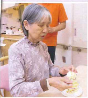
一口でいけるかな?