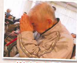
どんな願い事をされたのでしょうかw