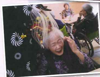
めっちゃ噛まれてます