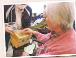
お賽銭もしていただきました!