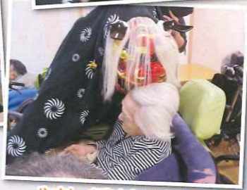
やさしく噛まれてます♡