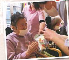
プレゼントも喜んでいただけました☆