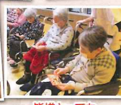
皆様とっても真剣でしたw