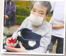
記念に1枚持って帰りました☆