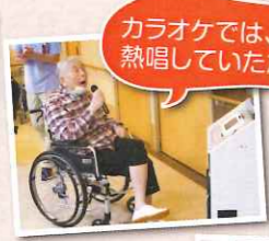
カラオケでは、北国の春を熱唱していただきました!!