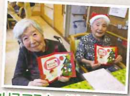
クリスマスカードもプレゼントさせていただきました(^o^)/