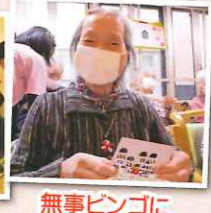
無事ビンゴになりました〜♪