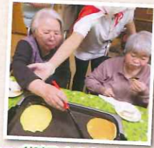
ひっくり返すのもバッチリ!