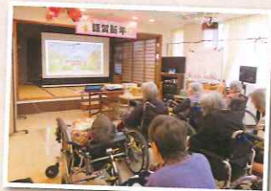
皆様モニターにくぎ付けでした(^o^)/