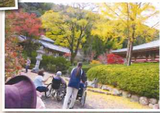
イチヨウの木も素敵でした!