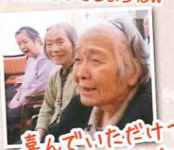
喜んでいただけましたよかったです☆