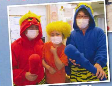
今から退治されるぞ♪