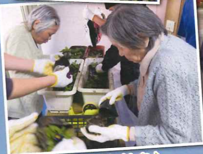
楽しんでくれました♪