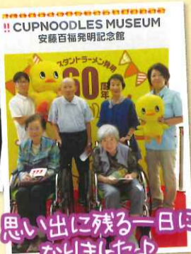
思い出に残る一日になりました!