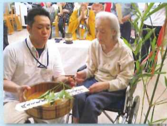
ご先祖様をご供養

一般的にはご先祖様を偲ぶ日とされており、地方によって異なるが7月もしくは8月13日~16日に行われるとされています。施設では日にちが少しずれましたが、8月21日に実施しました。