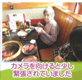
カメラを向けると少し緊張されていました