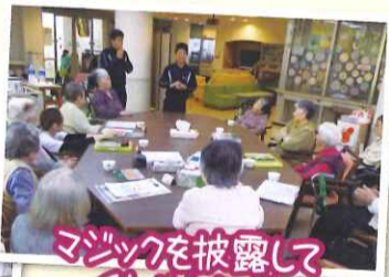
マジックを披露してくれました!!