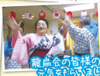
龍扇会の皆様の踊りで元気をもらいました!!