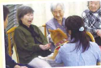
皆様ニコニコされていました。