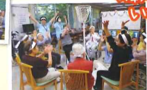
表彰状を授与させていただきました