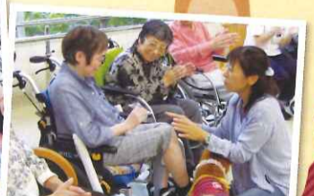
誕生日プレゼントもいただきました!