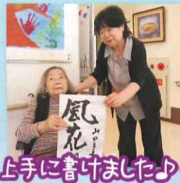
上手に書けました♪

毎月書道の先生をお招きし、利用者様の書道をお教わっており、なかなか筆を執る機会もありませんが、皆様真剣に取り組まれております。上手に書かれており、書いていただいたものを家族様にも見ていただけるように展示しております。