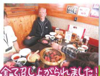
全て召し上がられました!

家族様も参加いただき、施設の近くにある五色亭に行くことができました。何度かお邪魔させていただいており顔見知りになりつつあります。帰りにはジャパンでお買い物も行けました。今後どんどん利用者様と一緒に外出に行けたらと思います。