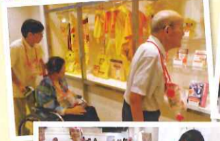
どの色にするか迷ってしまいますね(笑)