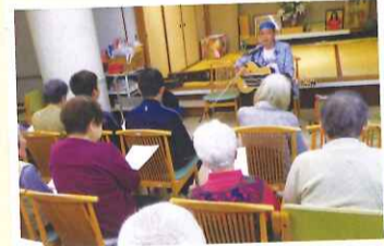
歌のおじさんの松下様にもお越しいただきました。