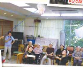
落ち葉キャッチゲーム