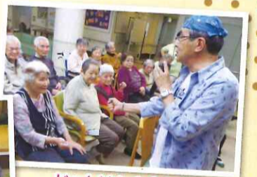
じゃんけん大会も大盛り上がりでした☆