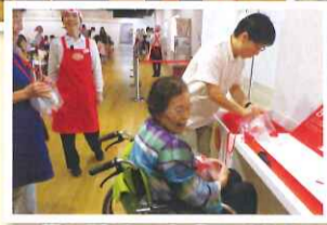
袋に詰めて完成ですね!!