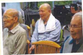
皆様口ずさんでおられました!!