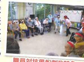
ピンポン回しお玉リレー