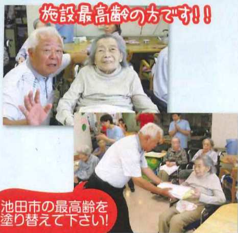
施設最高齢の方です!!

ボランティアで三味線の演奏を予定しておりましたが、台風の影響で来ていただくことができなくなり大変残念でした。当施設では100歳を超える方が6名おり、他の皆様もその方達の年齢をと元気に生活されております。