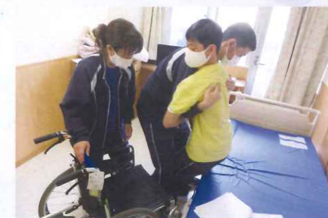
移乗を学んでいます