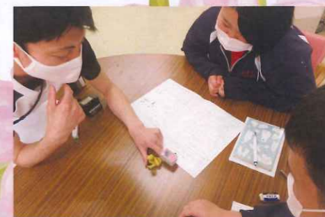
医療の事もしっかり勉強!