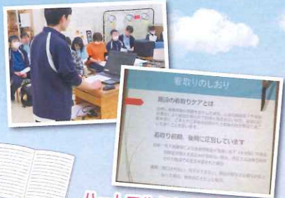
ハートフルふしお看取りの定義

2月17日に看取り勉強会を開催いたしました。看取りケアの基本から、家族様との接し方など色々学びました。ハートフルふしおでは「看取り」を二段階(前期・後期)に設定しております。