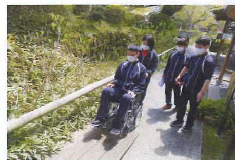
とっても良い天気でした