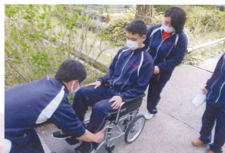
久安寺さんで車いす介助の特訓