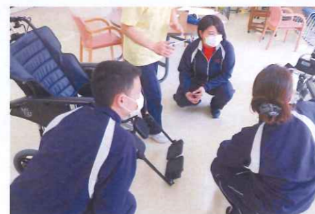
車いすの機能を教わっています