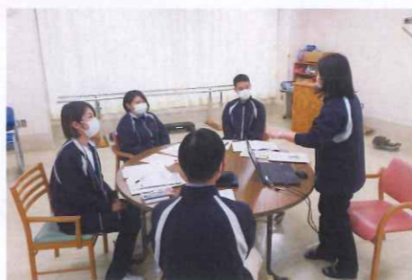
初日はさすがに緊張しています!