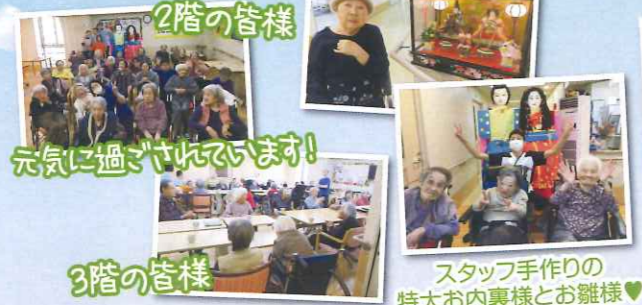
2階の皆様 元気に過ぎやうです!

3月1日に少し早いですが、ひな祭りを各階で実施いたしました。今回は特大のお内裏様とお雛様を、利用者様と一緒に作成しました。少し大き過ぎましたか(笑)