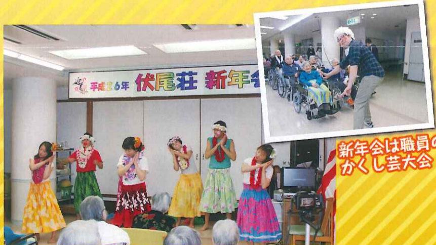
職員フラダンスのフィニッシュ

1月19日に新年会を行いました。獅子舞演舞や、新人職員の紹介やフラダンス、ボランティアの方による歌謡ショーを、笑顔でご覧になりました。今年1年も皆様と共に、楽しんでいただけたら幸いです。