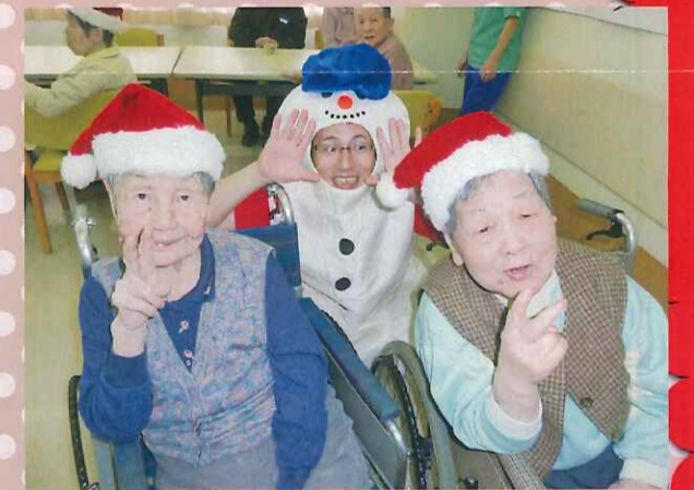
メリークリスマス