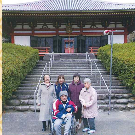
本堂の前で記念に1枚