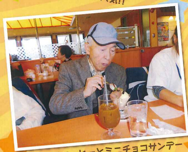
アイスコーヒーとミニチョコサンデー