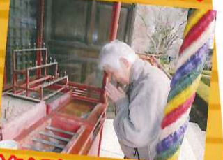
今年も元気で暮らせますように