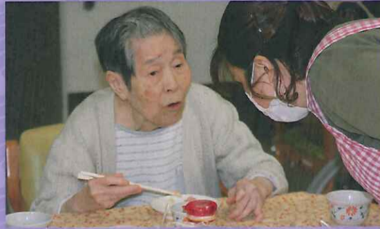
デザートも美味しいよ

12月8日の忘年会で、お食事会を行いました。屋台を設定し、握り寿司やケーキをお出ししました。握り寿司はとても好評で、皆様「美味しい!」「お寿司なんて久しぶり」と喜ばれ、お腹いっぱい召し上がられていました。