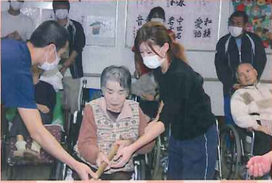
一緒につきましょうね