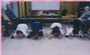
豆飛ばし 職員も頑張っています!!