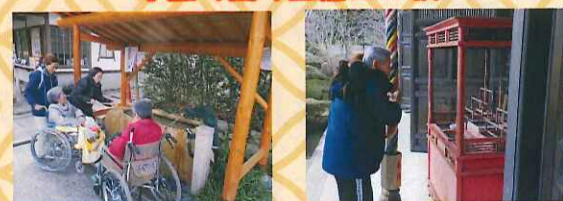
手を清めています。頑張って階段を上りました!!

1月は毎年恒例の初詣に行ってきました。とても寒かったです。皆様に喜んでいただきました!!