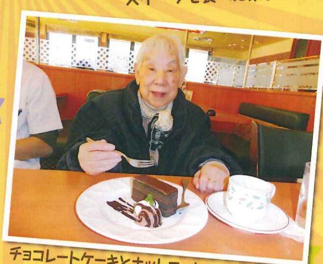
チョコレートケーキとホットコーヒーでほっと一息

デイサービスでは久しぶりの外出行事とあって、皆様に大変喜んでいただき、楽しいティータイムを過ごしていただきました!!