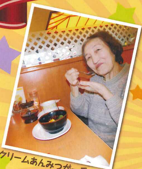
クリームあんみつが一番人気!!