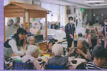
一杯召しあがってね