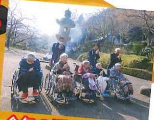
今年の願いを込めて

新年を迎え、久安寺へ初詣に出かけられました。お賽銭を入れ、皆様思い思いに願掛けをされており、その表情がとても印象的でした。寒い中での外出でしたが「外に出ると気持ちが良いね!」「初詣に行けて良かった」と、仰っておられました。