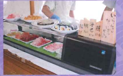
お寿司バイキング