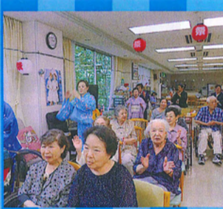
皆様にも手踊りへ参加してもらいました。