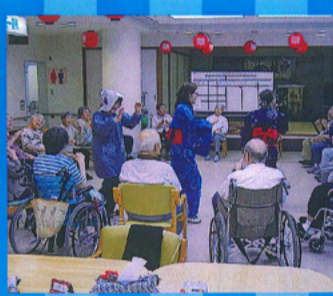
職員も頑張りました(笑)