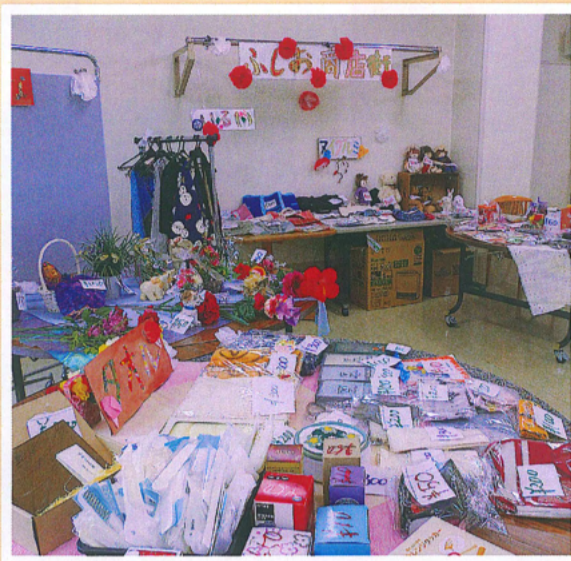
ふしお商店街です!!

6月12・13日の2日間にバザーを行いました。職員が色々なものを出し合って、利用者の皆様も何を選ぶかとても迷われていました。ふしおマネーを使い、買い物に行った気分を味わっていただきました。