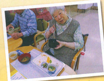
喜んでもらえました