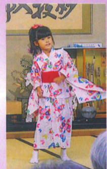
ああいちゃんも頑張ってくれました。