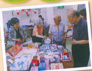
ご夫婦で相談されています