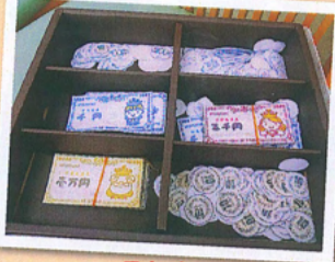
ふしおマネーです