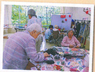
お孫さん用に選びました