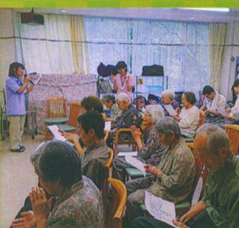
職員も歌いました!!