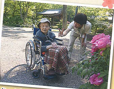
やっぱり外出はいいものですね!!