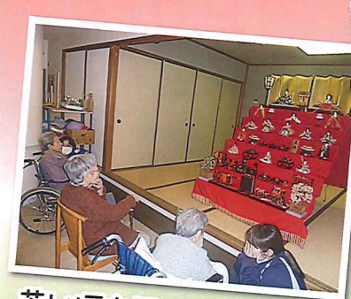
若い頃を思い出します!!