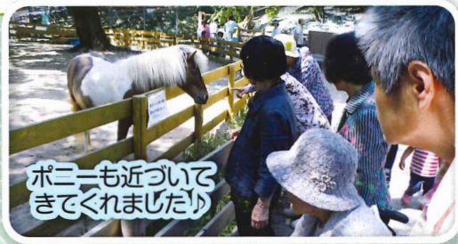
ポニーも近づいてきてくれました♪