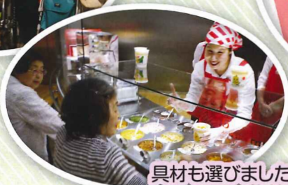
具材も選びました♪