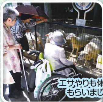
エサやりも体験してもらいました☆