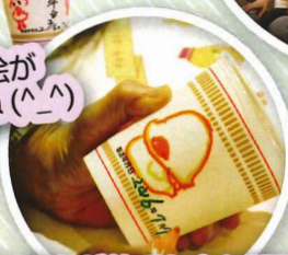
絵を描くことが苦手な方も頑張りました!!