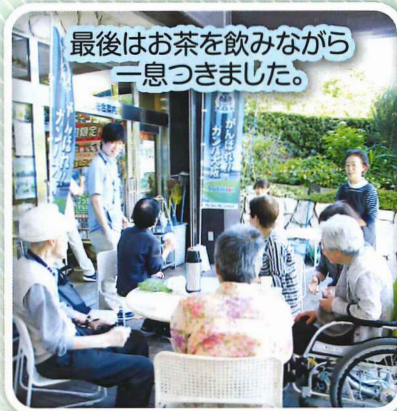
最後はお茶を飲みながら一息つきました。