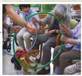
とっても人懐っこいです。