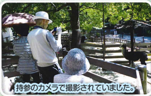
持参のカメラで撮影されていました。