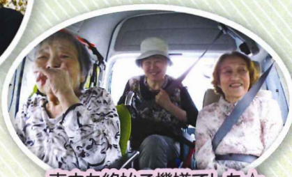
車中も終始ご機嫌でした☆