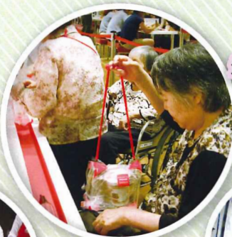
最後は袋に空気を入れて持って帰りました。