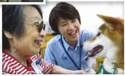
利用者様も職員も癒してくれました!!