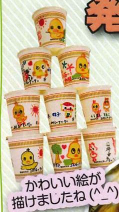
かわいい絵が描けましたね(^^)

池田に住んでいる方なら誰でも聞いたことのある、インスタントラーメン発明記念館に行っていました。マイカップヌードルファクトリーで自分だけのオリジナルカップヌードルを作ってもらい、工場で機械製造している工程を利用者様の手で体験してもらいました。また施設内を見学してもらい、インスタントラーメンの歴史を学ぶこともできました。