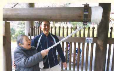
相談員と一緒に! 楽しそう♪