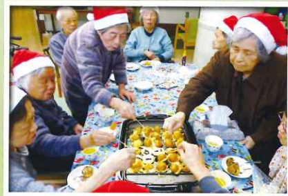
上手にひっくり返していました!!