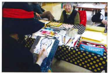
描いてもらうのは初めてで緊張されていました。