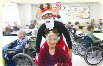
自然と笑顔になるショートケーキを届けてくれました♡また来年もお願いします♪