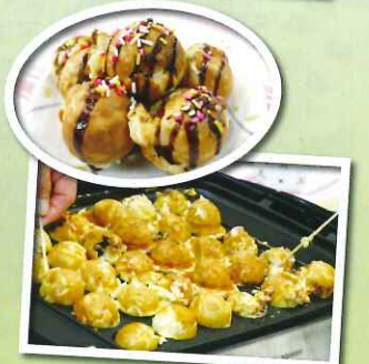
とても美味しかったです