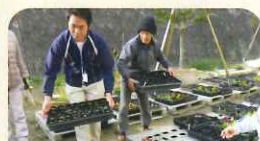
贈呈式に参加させて頂きました!