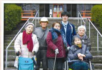
どんなことを祈願したんでしょうね!!