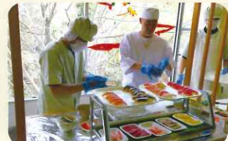
ハートフルふしお特製お寿司の屋台! 今年は職人の方も握りに来てくれました♪

普段なかなか外出には行けない為、施設内ですが忘年会としてお寿司の屋台を出して活気のある行事が出来ました。普段あまり食の進まない利用者様もおいしそうに頬張って召し上がっておられました。利用者様の満面の笑みをみることができ、良かったです!