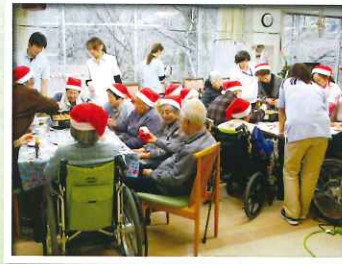
サンタの帽子もかぶりました~♪♪

26日の月曜日に、クリスマスパーティーと題してたこ焼きプレートにホットケーキ生地をして、その中にカスタードクリームや粒あんを入れてチョコレートをつまみつけて皆様にご覧いただきました。自分たちで作った、いつもとは違ったおやつに皆様に喜んでもらうことができました。