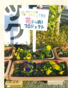
皆で植えました!利用者様の日課の水やりの成果でとても綺麗に咲いています♡