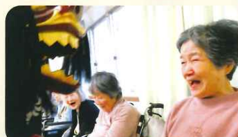
獅子舞に噛まれると良いそうです!