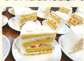
皆様とても美味しそうに召し上がっておられました♪

毎年、サンタクロースが美味しいケーキ・プリンを届けてくれています!クリスマスソングを皆で歌って、楽しいひと時を過ごしていただけたと思います。