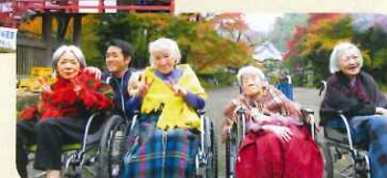
綺麗な色づきの紅葉に笑顔がこぼれ落ちていきます♡

毎年色鮮やかな紅葉を見に行くのが、皆様の楽しみになっていると思います。なかなか外出となると難しくはなりますが、出来る限り季節を感じて頂きたく思っております。