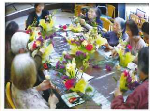
皆様の個性も出ていたりして(笑)