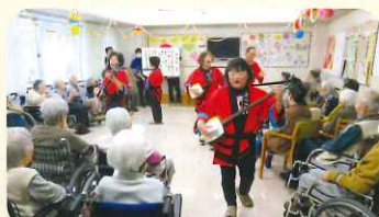
ボランティア「歌楽歩」の皆様。盛り上げて頂きました!

スタッフの獅子舞演舞やボランティアの皆様の力添えもあり、利用者の皆様にはとても楽しんでいただけたと思います。また今年もたくさんの行事をスタッフ一同盛り上げていきたいです!