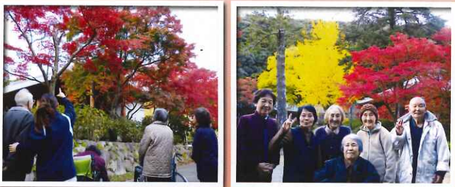
場所によって濃淡がありますね! いちようもきれいでした。

16日から24日の間に久安寺に紅葉見物に出かけました。今年は去年よりきれいでとても色鮮やかな紅葉を見ることができました。