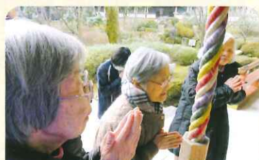
何を願っているのでしょうか♡