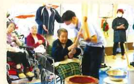
久々に杵を持ち真剣に「よいしょ〜」♪