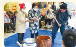
あまりにも力強くついて下さる為、スタッフ・ボランティア様はヒヤヒヤ(笑)♡