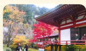
真っ赤でとても綺麗でした! (久安寺)

毎年色鮮やかな紅葉を見に行くのが、皆様の楽しみになっていると思います。なかなか外出となると難しくはなりますが、出来る限り季節を感じて頂きたく思っております。