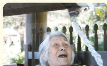
とってもいい笑顔♡