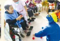
オニにめがけて一投! クリーンヒット♡