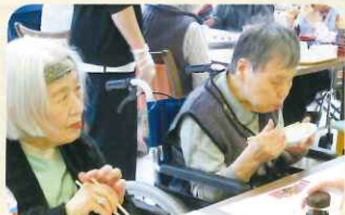
次は何を握ってもらおうかな♪と考えているのでしょうか♡