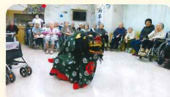
迫力のある動き!予習をたくさんしてくれたそうです(笑)