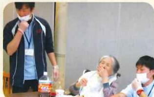
職員に挟まれご満悦♪ つい笑顔がこぼれ落ちていきますね♡