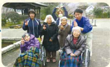
毎年恒例の初詣! 良い一年になりますように!

新年明けましておめでとうございます!!!本年も利用者の皆様がお元気で楽しく過ごしていただけますことをお祈りいたしております!