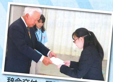
辞令交付。緊張の一瞬です!

今年も4名の新しい職員を迎え入れることができました。これから利用者様の生活をサポートしてくれると期待しています。それでは新卒3名のコメントを紹介させていただきます。