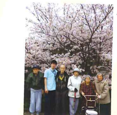
満開の桜を見ることが できました。