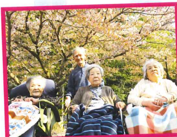
まだ少し寒さが残っていますが、外にでて気分転換になったでしょうか☆

今年は桜の咲く時期が例年に比べ遅かったように思います。その為、満開になるのが早く散るのも早かったのが少し残念です。それでも利用者様と見に行く桜は、みなさんの笑顔も相まってとても綺麗で心の安らぐものになります。毎年恒例ですがとても楽しみにしている行事の一つです。