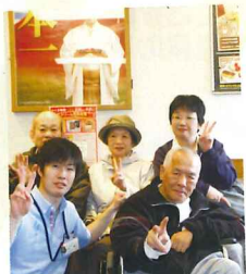
やっぱりお寿司は いいですね!!