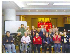
思い出に残る一日になりました!!