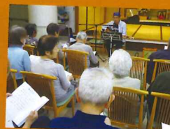
色々なジャンルの曲を 歌ってくださいます♪