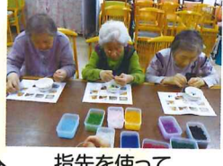
指先を使って 脳トレにもなります。