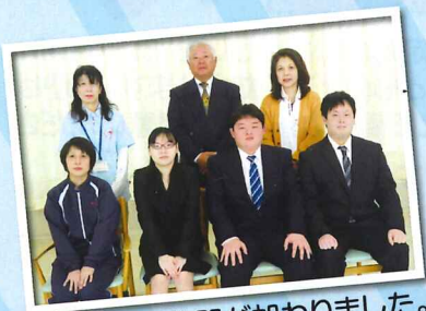
また新たな仲間が加わりました。

今年も4名の新しい職員を迎え入れることができました。これから利用者様の生活をサポートしてくれると期待しています。それでは新卒3名のコメントを紹介させていただきます。