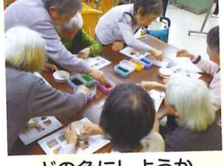
どの色にしようか 迷いますね(^_^)