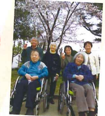
豊島野公園にも 行ってきました!!