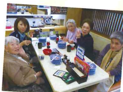
色々なお寿司のネタが ありましたよ〜