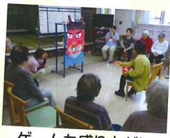
ゲームも盛り上がり ました(^ ^)