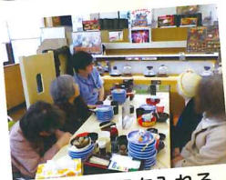
食べたお皿を入れる ゲームも面白かったです☆