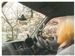
車中からもパッチリ見えました。