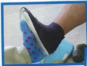
やっぱり大きいな!!!