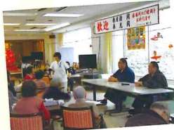
皆様興味津々でした。

3月2日(木)に、古江町にある「ふらっとイケダ」に3月12~26日の大阪場所があった間、宿舎(中川部屋)として滞在していることに伴い、ハートフルふしおに訪問していただくことができました。