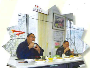
食べっぱいも 豪快でした☆