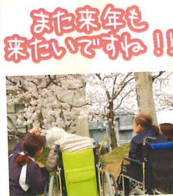
また来年も 来たいですね!!