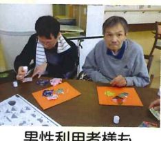
男性利用者様も 参加されています。