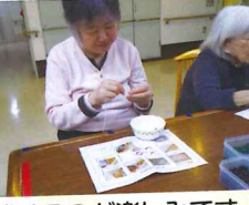
完成するのが楽しみです♪