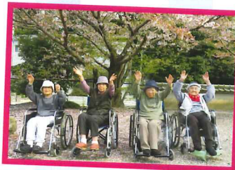
満開には間に合いませんでしたが、とっても綺麗でした♡久安寺の桜はいつみてもすばらしい☆