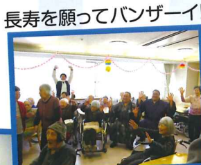
長寿を願ってバンザーイ!