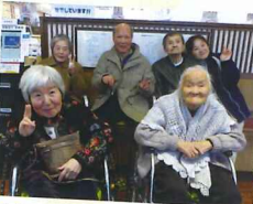
いい一日になりました♪