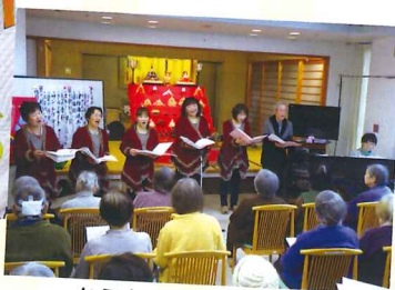
からあずの皆様です!!