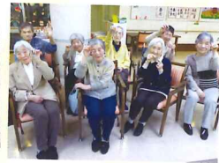
またつけてきて 下さいね〜☆彡