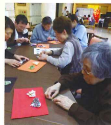
皆様とてもきれいに 仕上げられていました!!