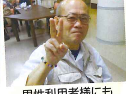
男性利用者様にも 好評でした!!