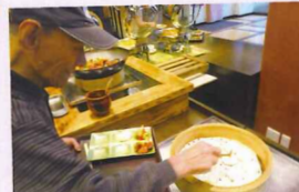
自分で選んで食べる♪良いな♡