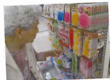
こんな物も売ってるんですよ

ダイエー多田店の中にある108円ショップへお買い物に行ってきました。前から欲しかった物などを買う事ができ、気分転換になったととてもよかったと好評でした。