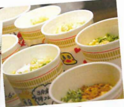
美味しそうですね☆