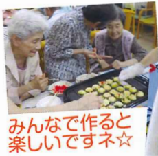
みんなで作ると楽しいですネ☆

アツアツのたこ焼きを作って、皆様笑顔になられながら美味しくいただきました。人気企画なので次回もお楽しみにお待ちしております!!