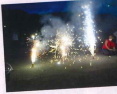
ナイアガラの滝!!!(笑)