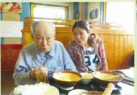
看護師さんの横だと食事が進むようでした♪笑