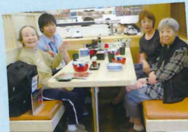
家族様の付添もあり、大変喜んでおられました!

恒例となる「回転寿司」いつもは食が細い利用者様もたくさん召し上がっていただけます。食べ過ぎには注意ですね(笑)