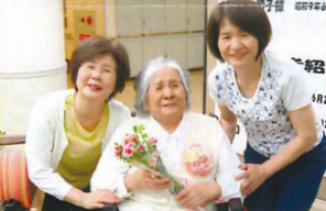
とっても感動して下さいました。