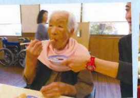
普段は小食ですが、お寿司は違いました♡