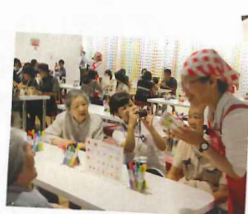
いろいろなお話が聞けて楽しかったです♥

2日間にわたり、池田市の観光スポットのインスタントラーメン発明記念館へ行ってきました。自分だけのオリジナルマイカップヌードルを作っていました。