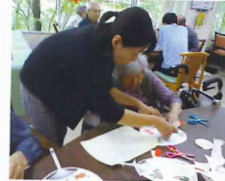
優しく教えて下さいました😊