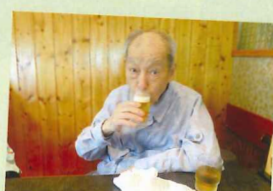
久しぶりのビール♪もちろんノンアルコールですが。

池田木部ジャパンの横にある「五色亭」に行ってきました。とっても美味しかったですよ。網で焼くやわらかいお肉に利用者様も召し上がりやすかったです♡