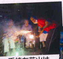
手持ち花火は少し怖そうです。