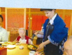
炙り寿司♪近くでの炙りはなかなか迫力がありましたね!!