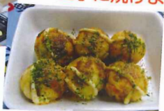
上手に焼けました