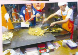
出店の焼きそばは最高♡