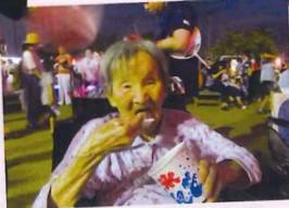
夏と言えば「かき氷」冷たくて美味しかった♡