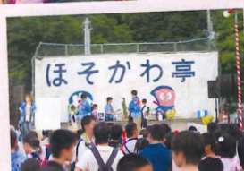
ほそかわ亭 細河まつり♪