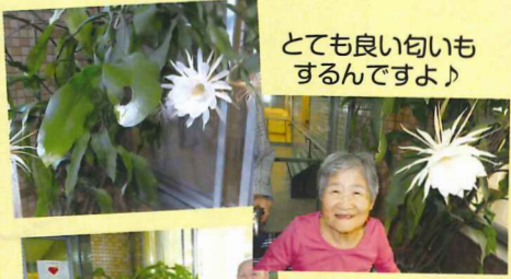
とても良い匂いもするんですよ♪

夜にしか咲かずに一日でしぼんでしまう「月下美人」ですが、今回は利用者様にも見ていただくことができました。なんとも言えない香りもあり♡うっとり♡しました。