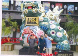
リニューアルしたようでずいぶん変わっていました!

箕面の大滝を上がる前にある、老舗の「箕面温泉スパーガーデン」の日帰りランチバイキングに行ってきました。約130種類のメニューから選んで食べるので、何を食べて良いかすごく迷いました(笑)とっても美味しかったです。