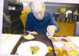
少し取り過ぎたかな(笑)