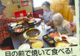
目の前で焼いて食べる!すごく美味しかったです♡また行きましょね♪