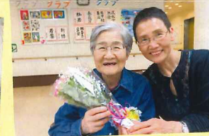
良い笑顔ですね!お義母さん♡