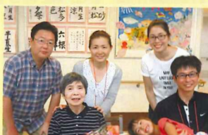
お孫さんも祝ってくれてご満悦♪

毎月第4日曜日に行っている、利用者様の誕生日会です。たくさんの家族様の参加があり、いつも大変盛り上がりしております。職員の歌があったり、施設長の手品があったり楽しい会になっています♡