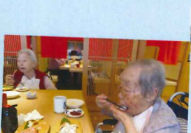
大好物を少しずつ♪