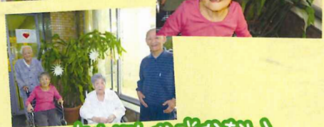
夜中にしか咲かない「月下美人」綺麗でした