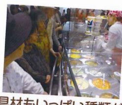
具材もいっぱい種類がありましたよ。