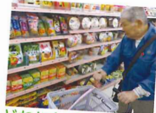
どれにしようかな～