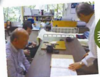
9路盤を使って教えてもらっています

5月より新規ボランティアとしてお越しいただく事になり、対戦相手やご指導いただいています。