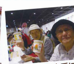
絵もとても上手に描けてますよ!