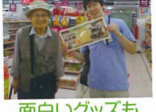
面白いグッズもたくさんありました♪