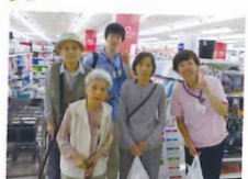
また来たいですね!!