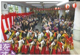
若いパワーをもらいました。