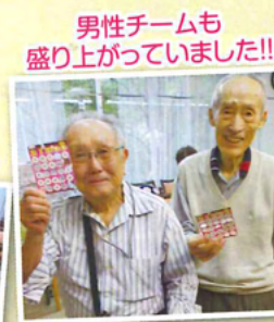
男性チームも盛り上がっていました!!