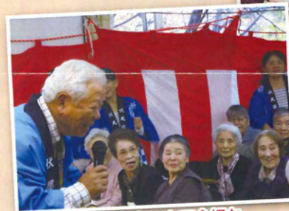
施設長のトークで会場も盛り上がっていました!!