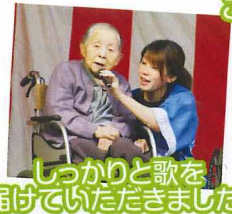
しっかりと歌を届けていただきました。