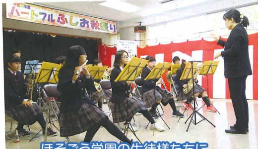
ほそごう学園の生徒様たちに、秋まつりの始まりを告げる演奏をどどけていただいております