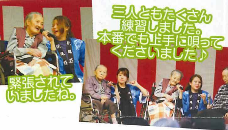
緊張されていましたね。