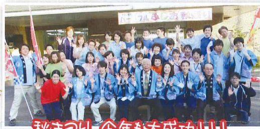
秋まつり 今年も大成功！！