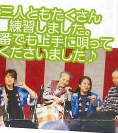
三人ともたくさん練習しました。本番でも上手に唄ってくださいました♪