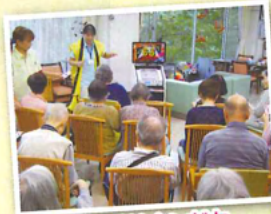
ジョイサウンドも使用しました☆