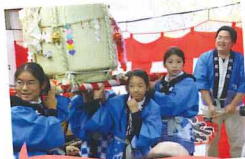
今年も“子供神輿”元気いっぱいでした。