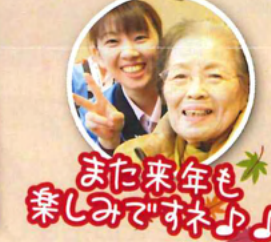
また来年も楽しみですね!!