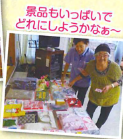
景品もいっぱいどれにしようかなあ~