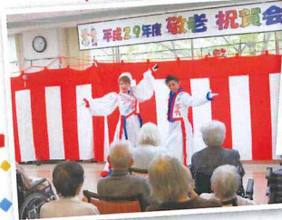
やはり元宝塚の方！すごく華麗で迫力があり、皆様大満足されていました♪