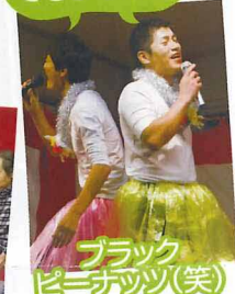
ブラックピーナッツ(笑)