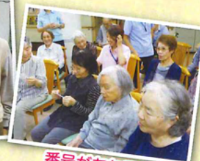
番号があたるとうれしいですよネ!!