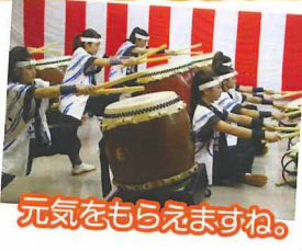
元気ももらえますね。

今年も最後に演奏をしていただきました。力強く太鼓を叩く姿にはいつも楽しませていただいております。忙しい中、毎年参加し盛り上げていただきスタッフ一同とても感謝しております。