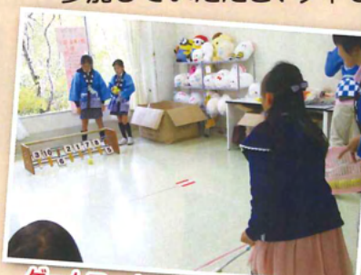
ゲームコーナーも大人気でした☆