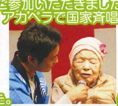
ためいきのような♪