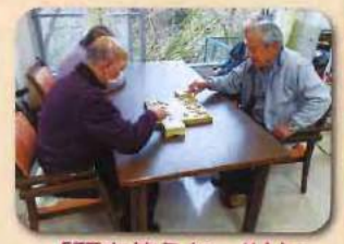
「頭を使うわ~!!」とおっしゃられていました☆