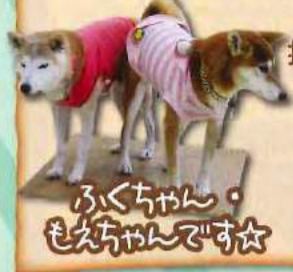
もえちゃんの特技を披露してくれました!!

11月30日にふくちゃん・もえちゃんコンビがハートフルふしおにきてくれました。利用者の皆様も二匹のかわいいわんちゃんに触れあう事ができてとても喜ばれていました!!