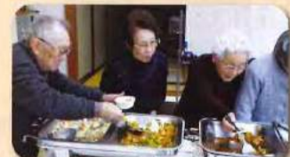
食べたい分だけ取っていただいています。