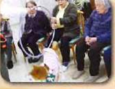
皆様何をしてくれるのか興味津々♪