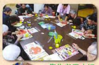
先生お二人にお越しいたごきしました!!