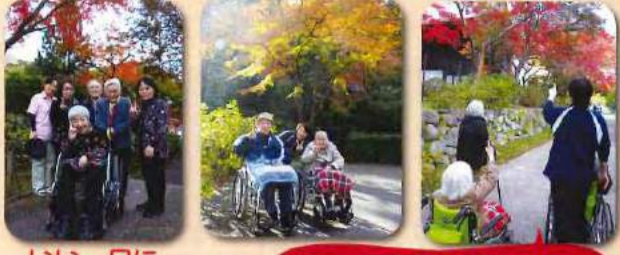
いい一日になりました♪