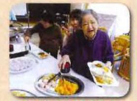
自分で選ぶのは楽しいですね!