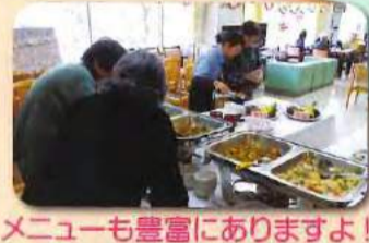
メニューも豊富にありますよ!!