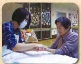
いい香りがして気持ちも落ちつきますネ☆

アロマのオイルなどを使用して、リラックスしていただくいい時間となっており、お話などもしていただき、参加される方はいい香りに包まれながらうっとりした気分を味わっていただいています。