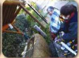
手水舎の水は冷たかったです。