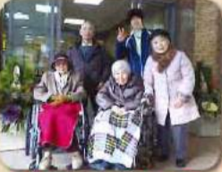
今年も一年元気に頑張ります☆