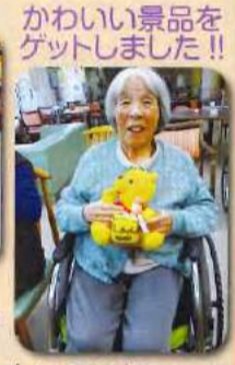
かわいい景品をゲットしました!!