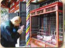
どんなお願い事をされているのでしょうか?!

4~10日にかけて久安寺へ初詣に行ってきました!!利用者様それぞれ願い事を祈られていて今年一年のいいスタートが切れたと喜ばれていました☆