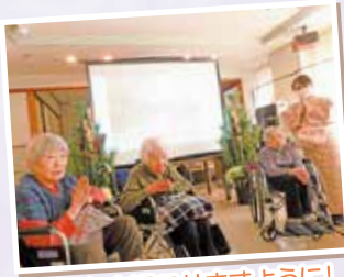
よい年を過ごせますように!

昨年に続き、リモート初詣で参拝していただいております。来年こそは、久安寺に出向けるように願っております。