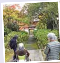
あの門まで行こうかな?