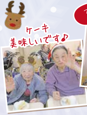
ケーキ 美味しいです♪

今年のクリスマス会も「ハレ」のケーキを召し上がっていただきました。毎年とても喜んでいただいております。クリスマスの歌も歌って楽しんでいただけました。