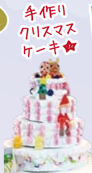
手作りクリスマスケーキ

クリスマスビンゴ大会を行ない、景品も数多く揃えていたことから、大変盛り上がりました。自分の為に必要なものを選ばれる方や、家族様にプレゼントするために選ばれる方など、様々な趣向で選ばれていました。おやつも、ケーキと、飲み物はコーヒー・紅茶・ジュースから選んでいただきました。