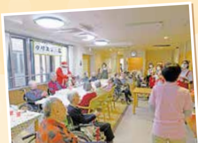
ハンドベルの音色に癒されました♡