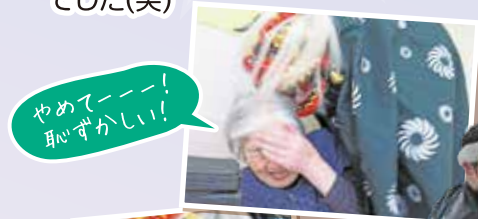
やめてー!! 真似ずかしい!

恒例のふしおの獅子舞がやってきました。躍動感溢れる演舞でとても盛り上がります。リアルな動きで、少し怖がられる様子もありました(笑)だんだん職員も年齢を重ねてきて、しんどそうでした(笑)