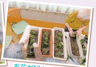
お花が好きですね♡