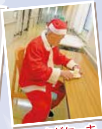
サンタがケーキ 食べてます(笑)