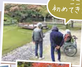
ここ、初めてきたわ〜