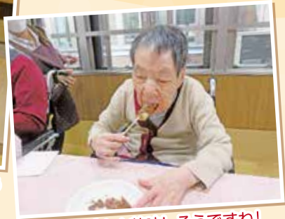
チョコバナナ美味しそうですね!