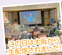
この日は大阪から生配信されました!

1月17・18日に新年会として、ビンゴ大会やオンラインレクリエーション、ホットケーキの調理を行ないました。「ZOOM」というアプリを使用したオンラインレクリエーションで、全国の施設様と一緒に同じ体操やクイズを行ない、普段とは違った構成の体操を行ないました。ホットケーキは、当初盛り付けを行っていただく予定でしたが、コロナの影響により職員にてさせていただきますこととなりました。しかしながら、普段、おやつを残される利用者様も大変喜ばれ召し上がっておられました。