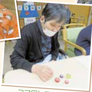
コマ回しコーナー