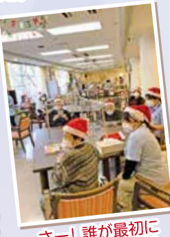
さー! 誰が最初にビンゴするのか!?