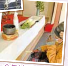
今年1年良い年になりますように...