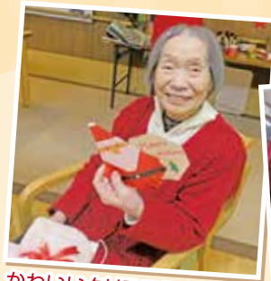
かわいいクリスマスカードも プレゼント〜♪