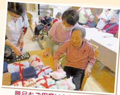
景品もご用意いたしました☆