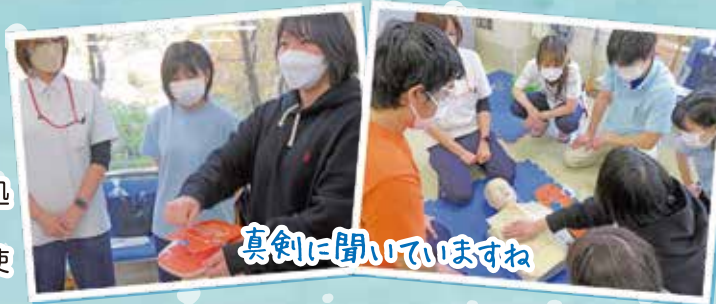
真剣に聞いていますね

加納総合病院から認定看護師の方をお招きして、BLS（一次救命処置）について勉強会を実施していただきました。 心停止かどうかの判断、心肺蘇生法の理解、AEDを安全かつ迅速に使用する。この3点の理解を目標に実演も交えて勉強しました。 救急隊が到着するまでに最善の処置をできるように努力していきます。