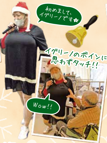
初めまして、 イグリーノです☆