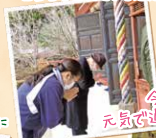
今年一年、 元気で過させますように♪

久安寺に初詣に行ってきました。 皆様思い思いの願いを込めて お参りなされていました。