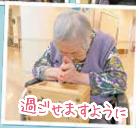
過ぎせますように