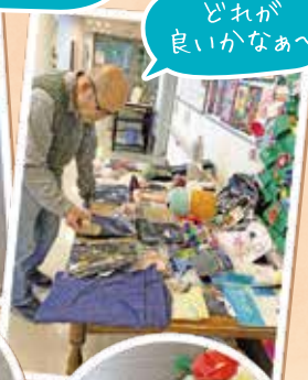
どれが いいかなあ～