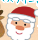
完成☆ 出来栄えが すごい!!