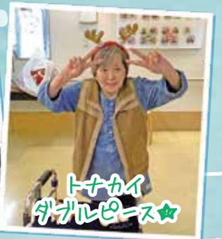
トナカイ がザルピース☆