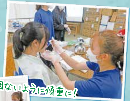
咽ないように慎重に!