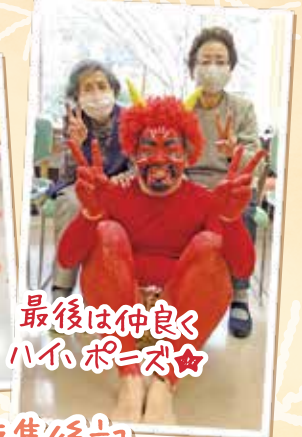
最後は仲良く ハイポーズ☆