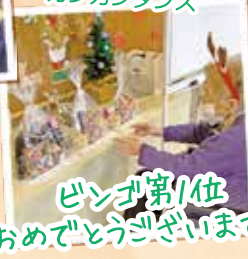
ビンゴ第1位 おめでとうございます!!