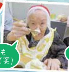
あんたも 食べるか(笑)