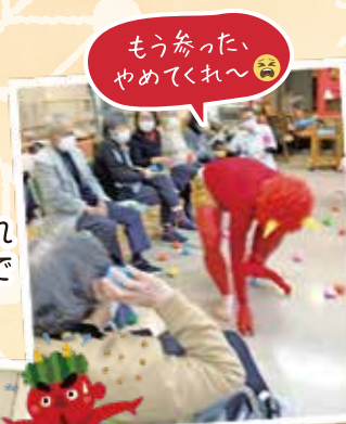
もう参った、 やめてくれ～