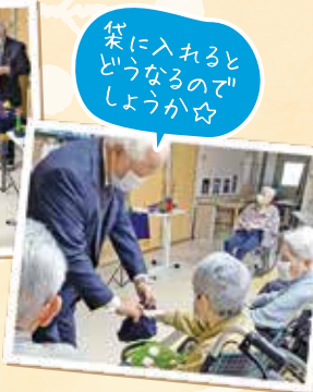
袋に入れると どうなるので しょうか☆