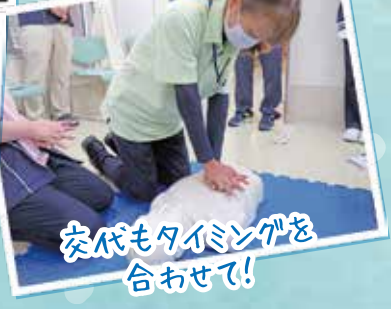
交代もタイミングを合せて!