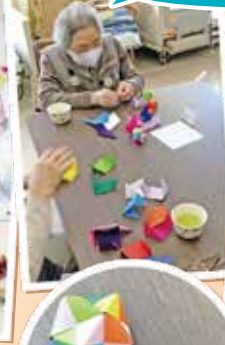
これ、何が 出来るのかなあ？