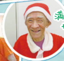
満面の笑み サンタ♪