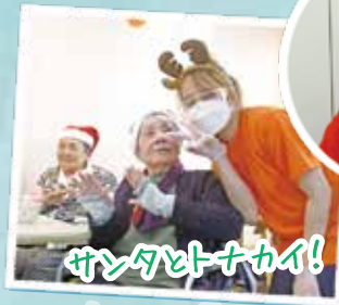
サンタとトナカイ!