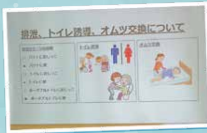
排泄介助について