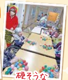
硬そうな 豆ですね(^_^)