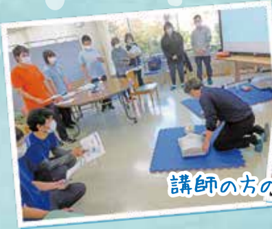
講師の方の実演です