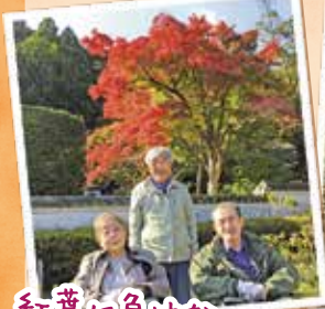
紅葉に負けない 笑顔です

久安寺に紅葉見物に行ってきました！ 寒い中ですが、久しぶりの外出で皆様マイ ナスイオンを身体いっぱい吸収し、綺麗な紅 葉に感激していました。