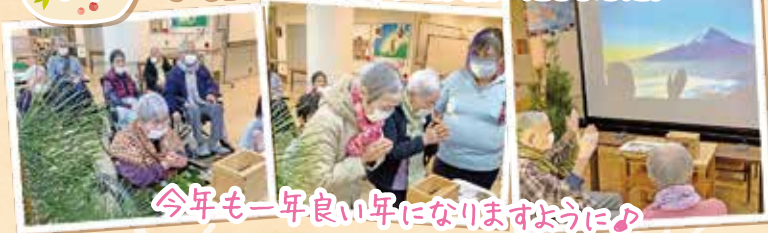
今年も一年良い年になりますように♪