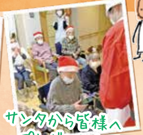
サンタから皆様へ プレゼント☆