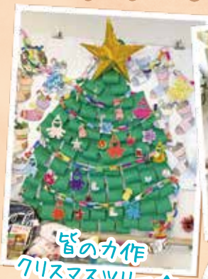
皆の力作 クリスマスツリー☆