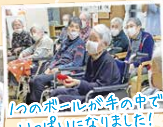
1つのボールが手の中で いっぱいになりました!