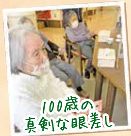
100歳の 真剣な眼差し

職員より集めた景品でビンゴ大会を行いました。 景品の中には空気清浄機やワイングラス、大きな ぬいぐるみなど色んなものが集まり、一番にビンゴ になった方より、好きな物を選んで頂きました。