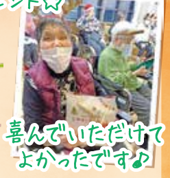
喜んでいただけて よかったです♪