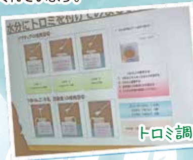
トロミ調整を学びましょう!